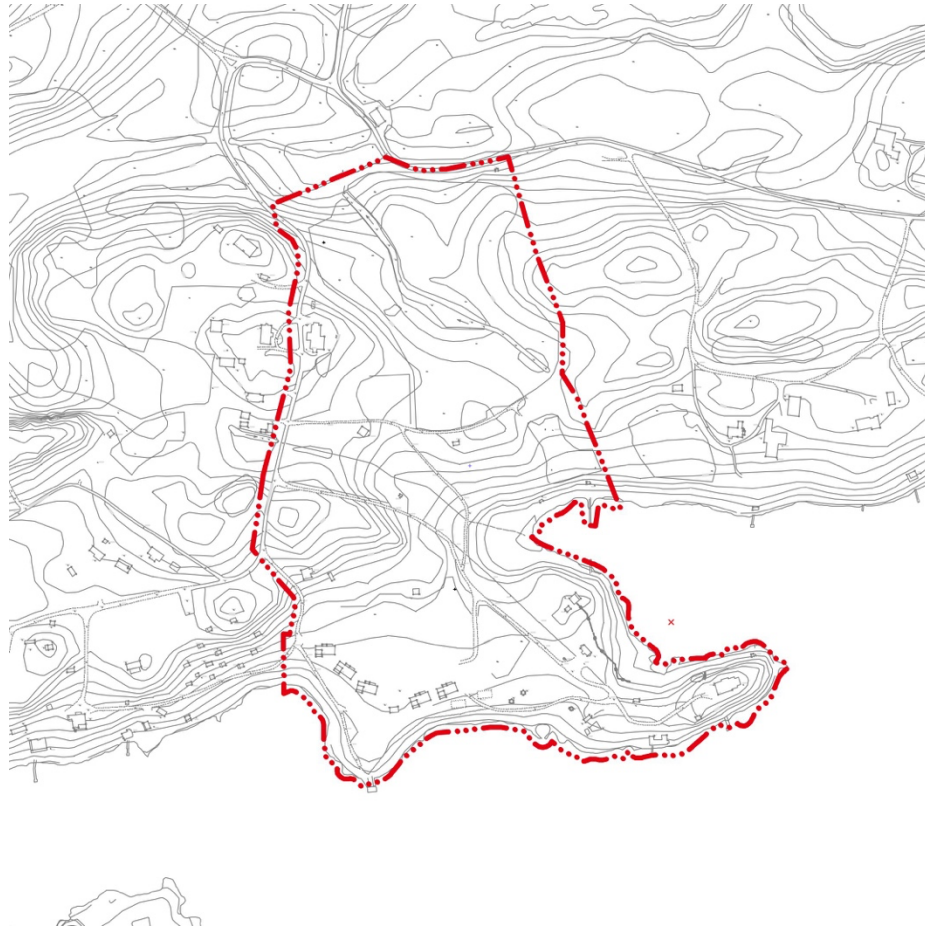
Kuva 1. Ranta-asemakaava-alueen rajausta pohjakartalla.

Kaavoitettavan alueen pinta-ala on n. 13,1 ha. Kaava-alueen rajausta on esitetty oheisessa kuvassa 1.