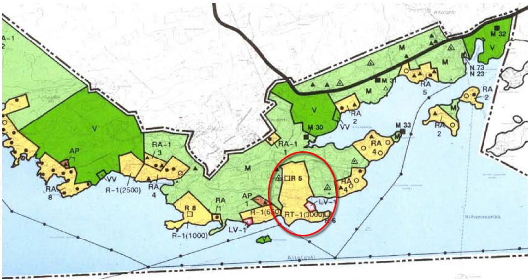
Kuva 3. Ote Aitolahdi-Teisko Rantayleiskaavasta. Kaava-alueen sijainti punaisella.

Alueella on voimassa Ympäristöministeriön 28.2.1994 vahvistama Tampereen kaupungin Aitolahdi-Teisko Rantayleiskaava . Siinä lähes koko kaavoitettava alue on osoitettu leirikeskusalueeksi, RT-1(3000). Suluisissa oleva luku tarkoittaa alueen rakennusoikeutta. Pättinlahden rantaa on osoitettu venesatamaksi tai venevalkamaksi, LV-1. Kaava-alueita rajaa lännessä, pohjoisessa ja idässä maa- ja metsätalousvaltainen alue, M. Merkinnöllä "R 5" ja "R 6" on osoitettu kaksi merkittävää rakennusta, edellisen tarkoittaessa Aitolahden entistä pappilaa ja jälkimmäisen niemen kärjessä sijaitsevaa Pättinniemen huvilaa (ent. Björknäs).